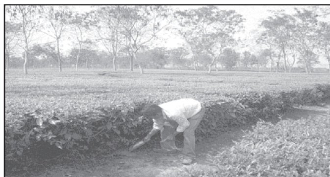
PCBA Officials engaged in collection of soil sample for Laboratory analysis

From analytical report it is found that soil is generally acidic in nature with pH range 4-6.5. The level of Pb is in the range 2.15 to 193.35 mg/kg of soil, Cu in the range 1.60 to 59.41mg/kg, Zn in the range 5.3 to 172.24 mg/kg, Cd in the range 0 to 18.34mg/kg, Cr in the range 0 to 102.6 mg/kg, and Ni is in the range of 3.34 to 169.82 mg/kg of soil.