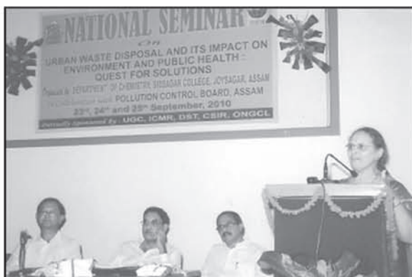
A view of the seminar 'Urban Waste Disposal and its impact on Environment and Public Health - Quest for Solutions'

Scholars, experts, scientist, academician, young researchers, personnels from Public Health Department and Industrial Department attended the seminar and deliberated their research works on the urban waste disposal and its impact on environment and public health and also on its management strategies.