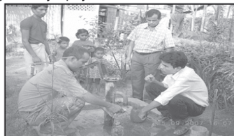
PCBA Officials engaged in collecting Samples of Drinking Water for laboratory analysis

The tea garden workers have been found to suffer from a large number of diseases like gastroenteritis, diarrhoea, dysentery, skin diseases etc. and many of them are water-born diseases. To prevent these diseases access to the safe drinking water by the workers of the tea gardens is essential. Hence, to assess the drinking water quality, water samples from selected tea estates were collected and analyzed in the central laboratory of the Assam Pollution Control Board for 12 parameters covering the major physical and chemical characteristics.