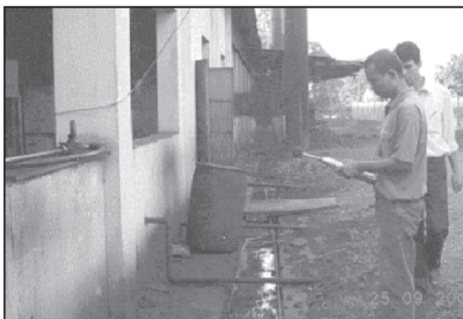
PCBA Officials engaged in Ambient Noise Level Monitoring

Air is used in large quantities under controlled condition of temperature and humidity. Fuels used are generally wood, coal, oil and LPG. To produce one tone of dried tea it requires approximately 450 KW of electricity, 500 liters of oil and other fuel with 2050 tonnes of air depending on the process used. The main source of air emission in the tea industry is DG set which is operated during power shutdown period. However, the smoke emitted through the chimney has its negative impacts on the ambient air. Ambient air quality was analysed using standard devices and techniques in each of the selected tea estates. Noise levels were also monitored for each of them.