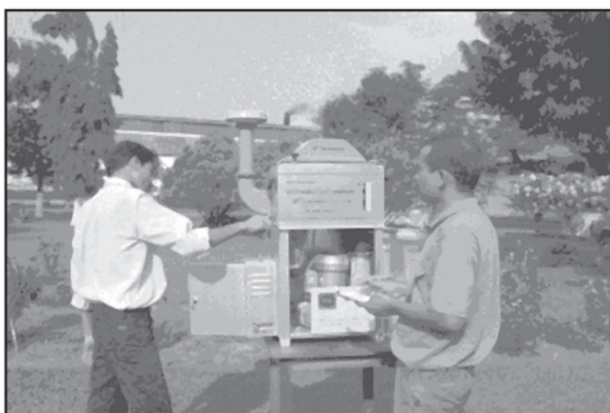
PCBA Officials engaged in Ambient Air Quality Monitoring

Agricultural practices produce hazardous pollutants of air, water and soil. Particulates are added by wind erosion of soil unprotected by tillage, by burning of any fuel and residues, which release oxides of sulphur and nitrogen. Volatile pesticides are carried to a great distance by wind. The smokes emitted through the chimney also have their negative impacts on the