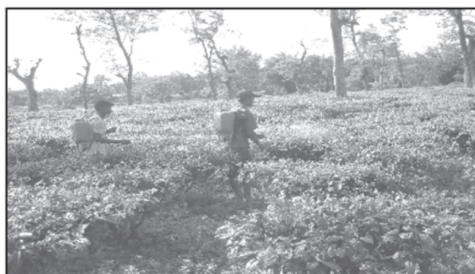
Workers are spraying pesticides on tea crops at a tea garden without any precautionary measures

From analytical report it is found that soil is generally acidic in nature with pH range 4-6.5. The level of Pb is in the range 2.15 to 193.35 mg/kg of soil, Cu in the range 1.60 to 59.41mg/kg, Zn in the range 5.3 to 172.24 mg/kg, Cd in the range 0 to 18.34mg/kg, Cr in the range 0 to 102.6 mg/kg, and Ni is in the range of 3.34 to 169.82 mg/kg of soil.