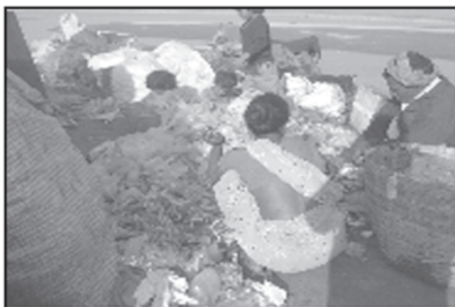
Rag Pickers collecting Bio-medical Waste from garbage dumping ground at Maijan, Dibrugarh

Shri H. R. Phukan, Regional Officer, Dibrugarh, Pollution Control Board, Assam has reported that the office has taken the matter of illegal dumping of Bio-Medical Waste (BMW) along with the Municipal Solid Waste (MSW) by some Health Care Facilities (HCFs). During recent inspection of municipal garbage dumping ground at Maijan by the officials of Dibrugarh Regional Office, it was found that huge quantity of BMW is being recollected by the rag pickers from the dumping ground. These BMW are supposed to be treated and disposed separately as per Bio-Medical Waste (Management & Handling) Rules, 2000. The presence of the huge quantity of BMW in the dumping ground proved that HCFs of the Dibrugarh Town are not treating the waste as per the Rules (Photograph).