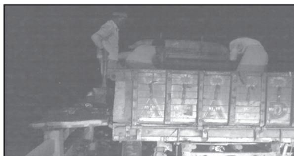
MSW are being dumped into Barak River from Sadarghat bridge at night on 26 th September, 2010.

The Deputy Commissioner, Cachar, called an urgent meeting on 28 th September at 12 noon after the news published in local media and asked the Regional Office of the Board to investigate the incident in details and to